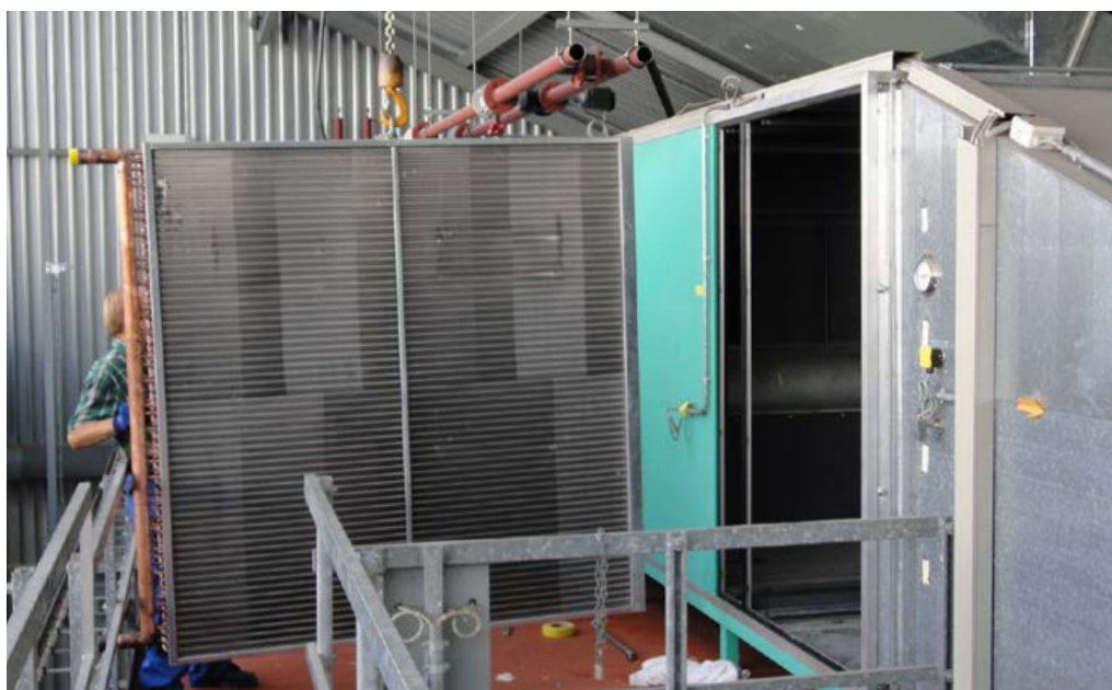
Sostituzione della batteria di riscaldamento ad aria

Grazie a una fase preparatoria eseguita in modo dettagliato, l'implementazione non ha riservato sorprese importanti e i costi previsti non sono stati superati. Dopo i lavori di trasformazione durati tre anni, nel 2015 già oltre il 51% (6600 MWh) del fabbisogno di calore era soddisfatto tramite calore residuo proprio. Entro il 2020 la percentuale di calore residuo proprio dovrà toccare il 75%. Tale risultato verrà raggiunto grazie all'integrazione del laser a elettroni liberi a raggi X SwissFEL, attualmente in costruzione, che fornirà un notevole quantitativo di calore anche in inverno.